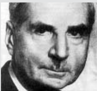
Walter Schottky (1886 bis 1976)

das Herstellungsverfahren dazu, heute als „Sputtering“ bezeichnet, fand.