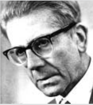
Friedrich Hund (1896 bis 1997)