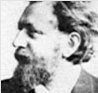
August Kundt (1839 bis 1894)