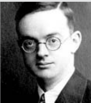
Pascal Jordan (1902 bis 1980)