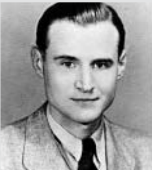
Hans-Joachim Pabst von Ohain (1911 bis 1998)

periment wurden Silber- und Wismutatome durch Magnetfelder geschossen. Dabei entdeckte man eine Aufspaltung der Strahlen, die vorher in einer Hypothese der Quantentheorie vorhergesagt wurde. Der entscheidende Erfolg, das Stern-Gerlach-Experiment, gelang im März 1922 in Frankfurt a. M. Zu dieser Zeit war Stern nach einer Berufung zum 1. Oktober 1921 bereits Professor für Experimentalphysik in Rostock. Ab dem 1. Januar 1923 aber schon an der Universität Hamburg. Der zunehmende Nationalismus und Antisemitismus beeinträchtigten die Arbeiten von Otto Stern und seinen Mitarbeitern. Kurz bevor er 1933 von seinem Dienst als Hochschullehrer suspendiert wurde, reichte er seine Kündigung ein und folgte einer Einladung des Carnegie-Institute of Technology in die USA. Nach dem Ende des zweiten Weltkrieges 1945 nahm er den Nobelpreis entgegen, der ihm für das Jahr 1943 verliehen worden war.