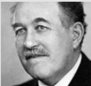
Nobelpreisträger Otto Stern (1888 bis 1976) Nobelpreisträger 1943