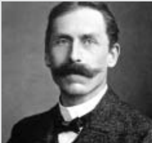
Friedrich Paschen (1865 bis 1947)