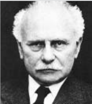
Johannes Stark (1874 bis 1957) Nobelpreisträger 1919